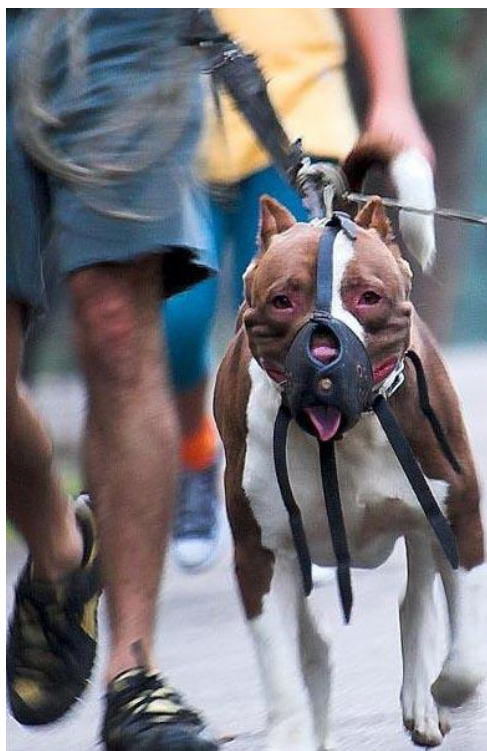
Собака породы «питбультерьер» в наморднике

Если вблизи имеется укрытие или дерево, медленно отступай к нему спиной, не делая резких движений.