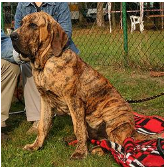
Бразильский фила, фила бразилейро — крупная рабочая порода собак, выведенная в Бразилии

промыть рану, обработать края йодом, наложить чистую повязку; выяснить, привита ли собака от бешенства; обратиться в травмпункт.